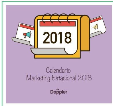
Calendario de Marketing Estacional 2018