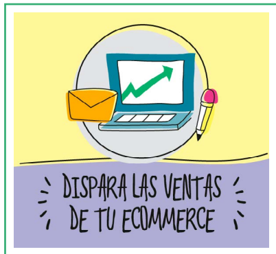
Estrategias de Marketing para Tiendas Online

¿Te ha resultado útil esta Checklist? Entonces te sugerimos estos materiales: